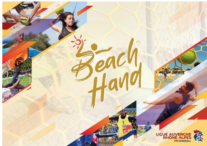
Murs BARNUM Boutique BEACH HAND