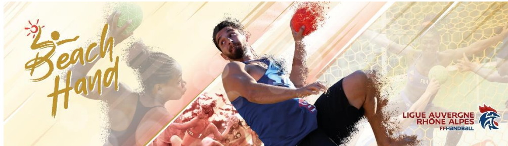
Banderole Espace Compétition