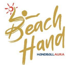
CHARTRE du BEACH HAND