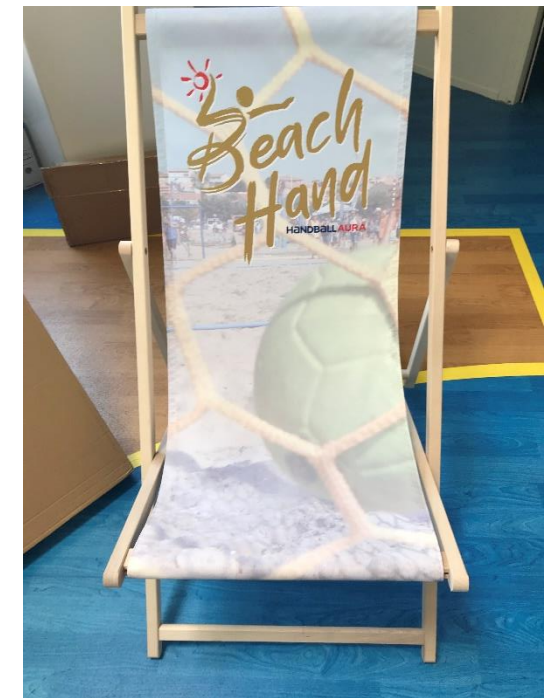
Transat BEACH HAND